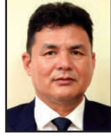
खम्मबहादुर खाती अध्यक्ष