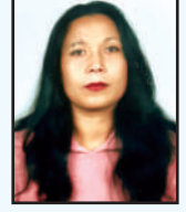
आर्या श्रेष्ठ सदस्य